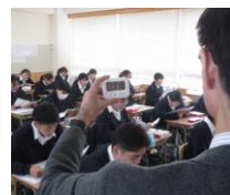
【写真】 タイマーによる音読活動の管理