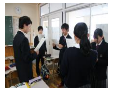
【写真】 インフォメーションギャップを利用した音読学習