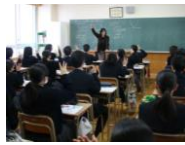
【写真】 体を使って表現する簡単な活動②